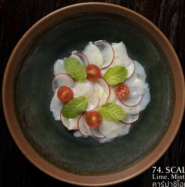
74. SCALLOP CARPACCIO Lime, Mint, Cherry Tomato, Radish คาร์ปาซิโอหอยเชลล์ 680.-