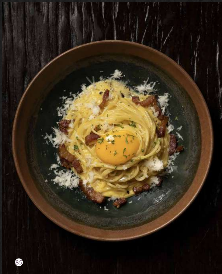
85. CARBONARA Bacon, Parmesan, Egg Yolk คาโบนาร่า 370.-