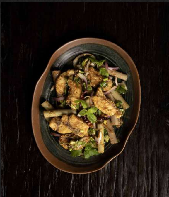
13. YUM TALAY Spicy Seafood Salad ยำทะเลรวม 420.-