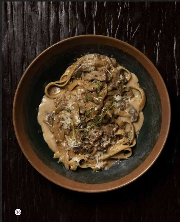
86. FETTUCCINE STROGANOFF Beef, Sour Cream, Mushroom, Pickle, Parmesan เฟตตูชีนีสโตรกานอฟ 680.-