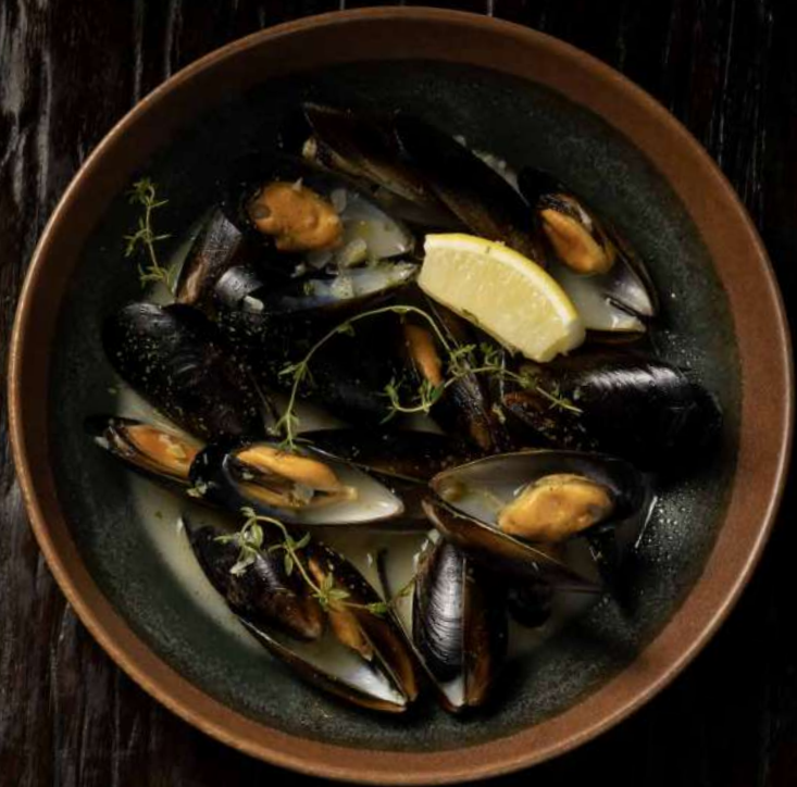
73. MOULES MARINIERE Mussels in White Wine หอยแมลงภู่อบซอสไวน์ขาว 550.-