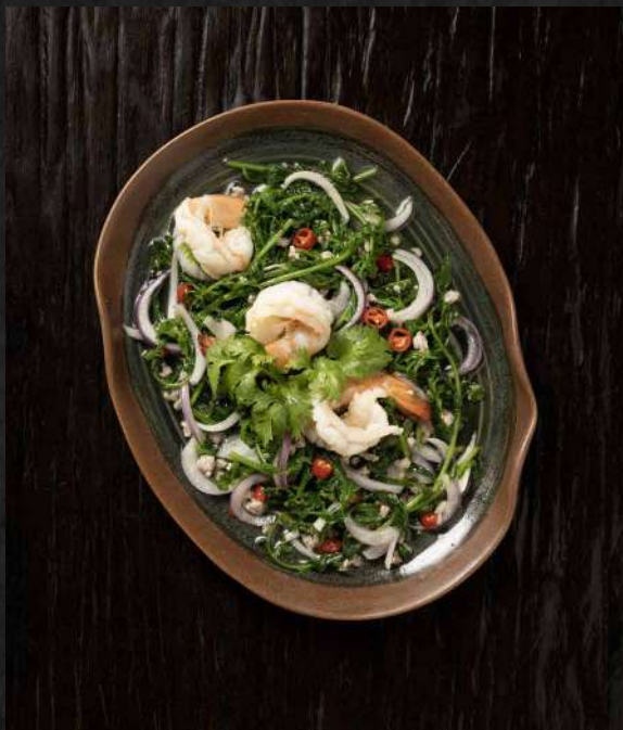
12. PACO FERN SALAD WITH SHRIMPS Paco Fern Salad with Minced Pork and Shrimps ยำผักกูดกุ้งสด 390.-