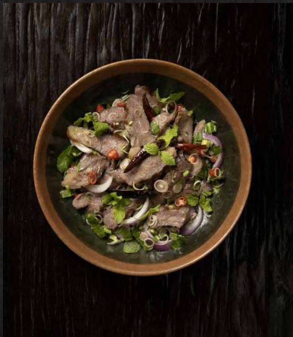
11. PLA NUEA Herb Salad with Grilled Australian Striploin ปลาเนื้อ สตรีปลอยน์ออสเตรเลีย 750.-